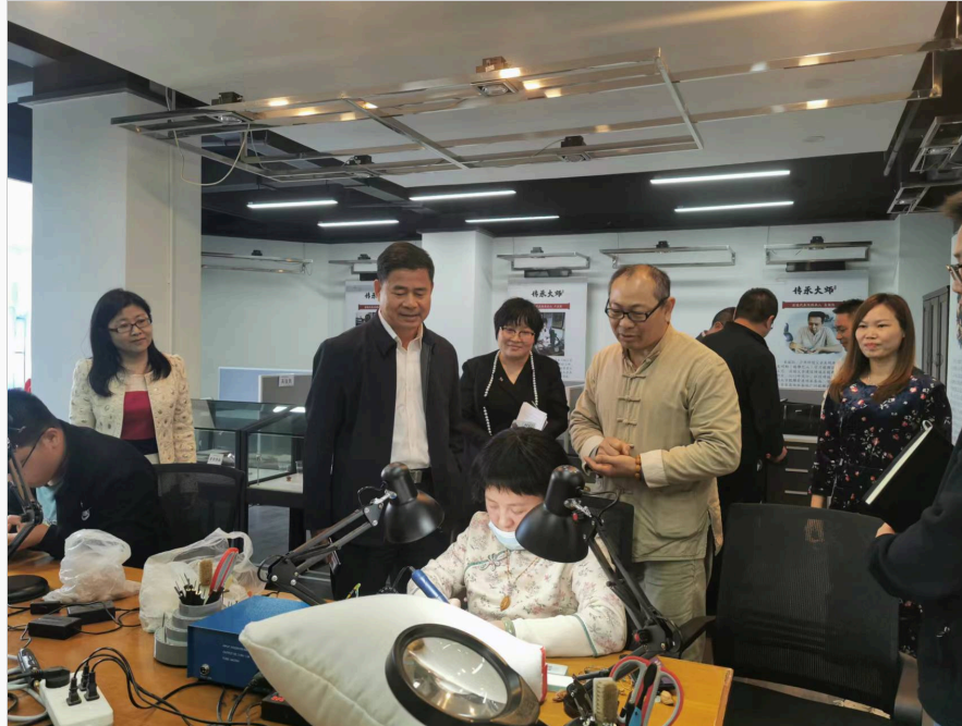
(省教育厅二级巡视员邱克楠视察我校榄雕传承基地)