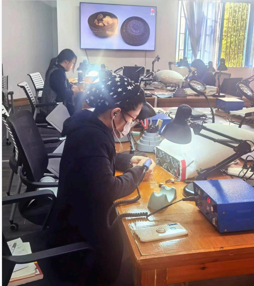
(榄雕社团学生精心打磨作品)

广东省高校中华优秀传统文化传承基地评选工作启动于2018年，历时4年共遴选出四批45个项目。省教育厅三级调研员康天东以数据说话，列举了4年来45所高校依托基地建设取得的可喜成果：拥有基地专职教师400多名，开设课程300多门，成立社团116个，涌现出国家级教学成果8项，省级教学成果奖28项，校级教学成果100多项，辐射高校学生60多万人，带动中小学校500多所，普惠人数80多万人次，开展国内国际交流展示活动600余次。