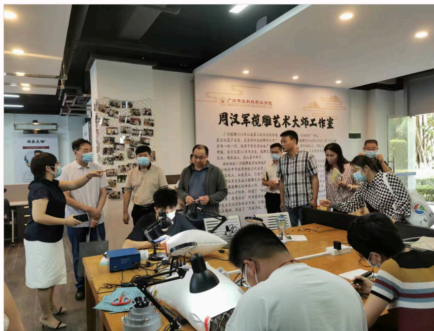
(省教育厅组织专家组考察我校榄雕传承情况)